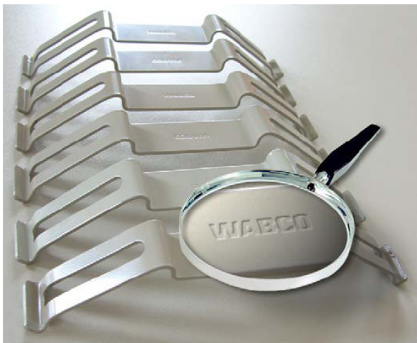
Obr. 3: Originální přitlačná pera WABCO

Upozorňujeme, že při použití náhradních dílů, které nejsou schváleny firmou WABCO, nelze na firmě WABCO uplatňovat zákonné nároky kvůli vadám a z nich vzniklým škodám.