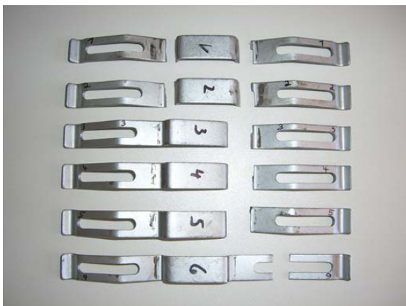
Obr. 2: Prasknutá přítlačná pera od cizího dodavatele

Výsledky testů prokázaly, že pera vykazují pouze 1,8 – 4,5 procent požadované životnosti. Z předčasných poškození testovaných per lze usoudit, že již dlouho před dosažením meze opotřebení brzdového obložení dojde k výpadku instalovaných přítlačných per.