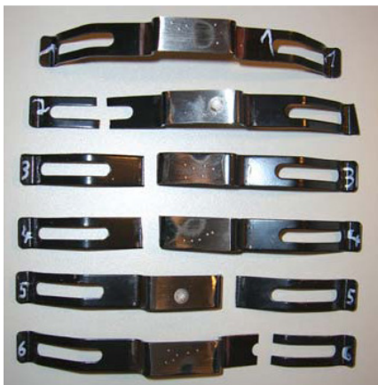
Obr. 2: Prasknutá přítlačná pera od cizího dodavatele

Výsledky testů prokázaly, že pera vykazují pouze 0,8 – 12,0 procent požadované životnosti. Z předčasných poškození testovaných per lze usoudit, že již dlouho před dosažením meze opotřebení brzdového obložení dojde k výpadku instalovaných přítlačných per.